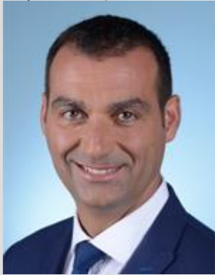
Député Christophe Blanchet président du CNAC depuis le 30 mars 2022